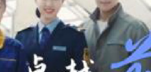
国聘北京地铁招聘专区