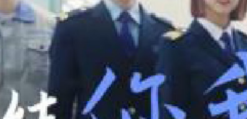
北京地铁招聘小程序